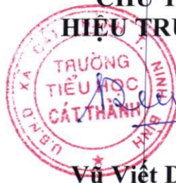
Vũ Việt Điện