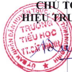
Vũ Viết Điện